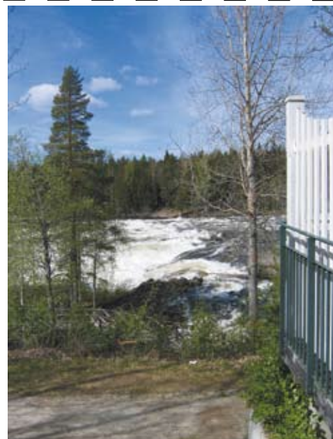
Utsikt över vindelälvens forsar från Hotell Forsen i Vindeln