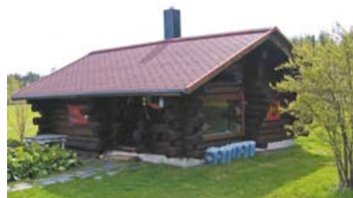
Byggnader som finns på Österlundstorpet