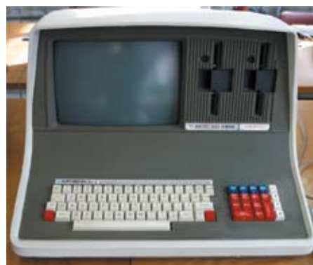
Ser inte riktigt ut så här!

Bygdeå församling ingår sedan sommaren 2009 i något som heter GIP i Luleå stift. GIP står för Gemensam IT Plattform och innebär att alla anställdas datorer är sammankopplade till en stor dator som står i Hortlax utanför Piteå. Fördelen med det är att alla anställda har tillgång till samma programvaror överallt och att informationen som hämtas alltid är aktuell. Om jag ändrar något i